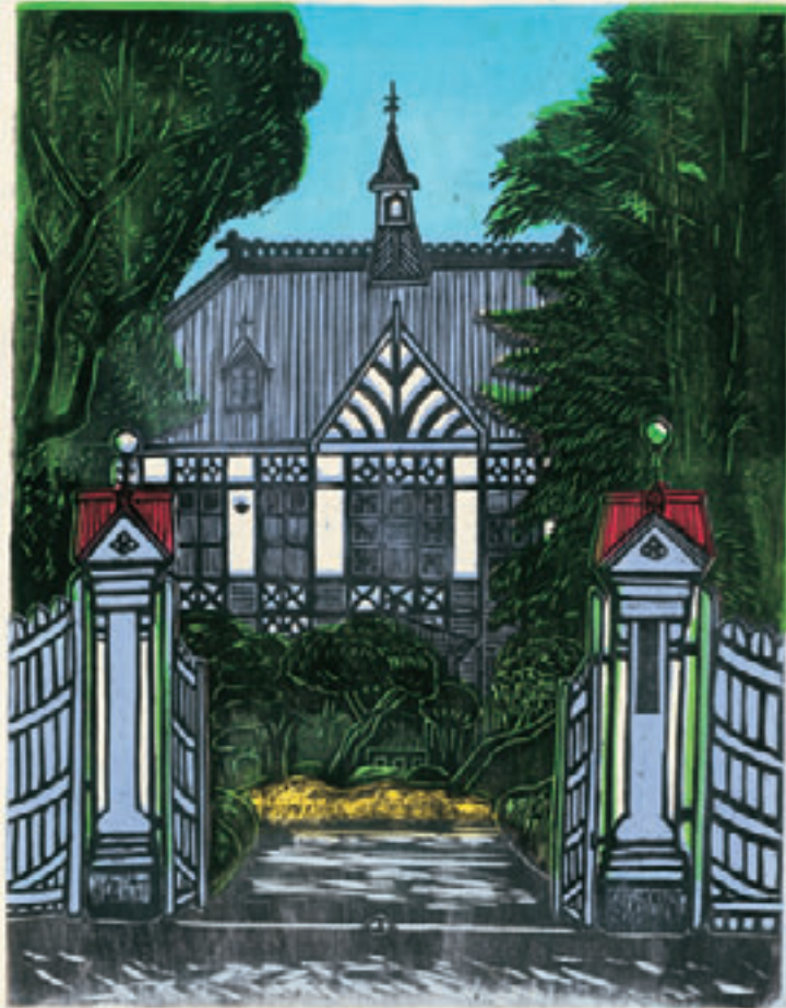
奈良女子大学正門

平成20年4月29日 [火・祝] ↓ 5月6日 [火] 午前9時～午後4時(入場無料)