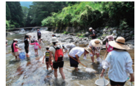
公開の野外体験実習の様子

The Center was established on April 1, 2001 and is dedicated to the study of a scientific discipline termed "KYOUSEI Science", defined as the study for co-existence of human society and natural environments. The Center aims to contribute to the environmental problems through multi-scale scientific research activities from physical chemistry, molecular biology, ecology, geography and geophysics.