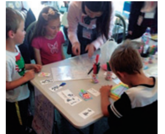
グローバル女性人材プログラムでの日本文化紹介イベント

The center is comprised of the International Exchange Planning Section and the International Education Section. The former carries out the planning and implementation of international exchange and promotes activities based upon academic exchange agreements. The latter offers education and support to international students and guidance for Japanese students going abroad.