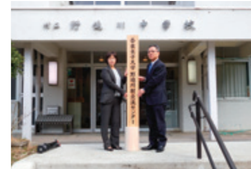
野迫川村交流センター開所式

In response to the selection of COC+ program, this center was established on December 1, 2015 and is dedicated to promote "Regional Collaboration and Education". Through innovation of education and career support system, this center aims to foster people and adjust environment for regional revitalization in Nara.