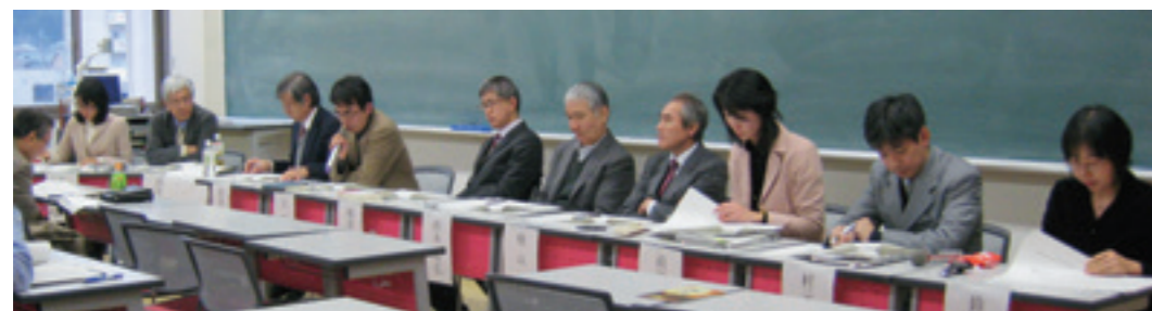
都城制研究会でのシンポジウムの様子

In addition to carrying out its own activities, since fiscal year 2009 this center has taken on the accomplishments of the "21st Century COE Program - COE for Research on formation and characteristics of Ancient Japan", and is widely promoting and releasing interdisciplinary research on ancient Japan in concert with researchers from the field of science. Accordingly, greater development can be achieved through cooperation with the network of domestic and foreign research institutions and researchers built through COE activities.