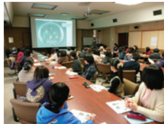
組換えDNA実験従事者安全講習会

The Center consists of three sections, the Management Sections for Chemical Substances, Radiations and Biosafety.