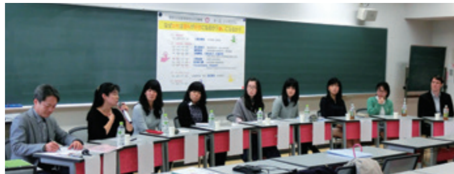
理系女性教育開発共同機構シンポジウムの様子

We carry out education and research in the direction of four projects: Hurdling Assistance for Women in Science Program, Secondary Education Reform Project, Higher Science and Engineering Education Reform Project, and Globalization Project. These are aimed at promoting research for the expansion of career choices in science and engineering for women and developing contextualized teaching materials and methodology in science and mathematics for secondary and higher education, thereby fostering female leaders equipped with scientific thinking.