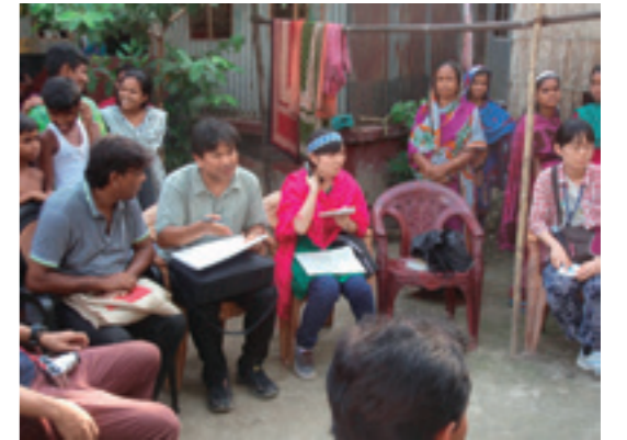
バングラデシュ研修での聞き取り調査

Established on November 25, 2005, the Center is dedicated to promote higher education for women in Asia. In present-day Asia, with its great diversity in history, culture, language and political systems, there are emerging sense of unity and common experiences shared by people living in Asia. The Center aims at addressing diverse gender issues in active collaboration with researchers in Asia and contributes to the society by demonstrating research findings, promoting mobility of researchers and nurturing of next generation with a view to establish gender equality within Asia.