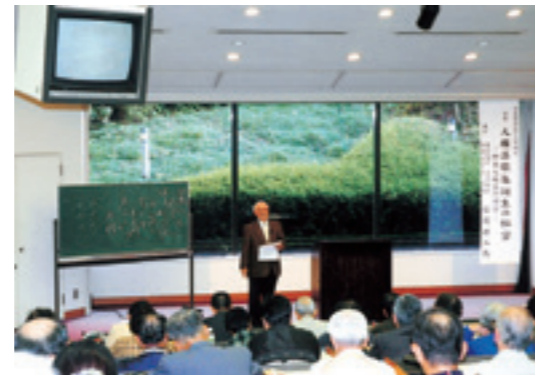
公開講座「人麻呂歌集誕生の秘密」

The Center will survey the promotion of lifelong learning as well as conduct research and development of lifelong learning programs by liaising with local lifelong learning organizations and groups.