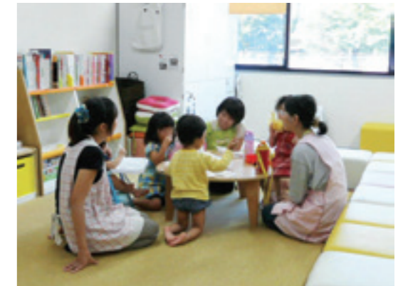
「ならっこルーム」での託児

The first Basic Principle of Nara Women's University is "cultivating human resources that will lead to a gender-equal society and disseminating information for the empowerment of women". The "Gender Equality Promotion Office" was founded in November 2005 to realize this principle by creating an environment where women and men in all fields can actualize their full potential. Its name was changed to the "Organization for the Promotion of Gender Equality" in December 2012, and it is currently comprised of the (1) Office of Gender Equality Awareness, (2) Office of Diversity in Research Environment, and (3) Office of Career Development for Postdoctoral Fellows and Graduate Students. It works to: raise people's awareness of the importance of gender equality; help its researchers with their research and education-related activities; assist its faculty, staff, and students in achieving their optimal balances between work/study and private lives; and support female graduate students and postdoctoral fellows to diversify their career.