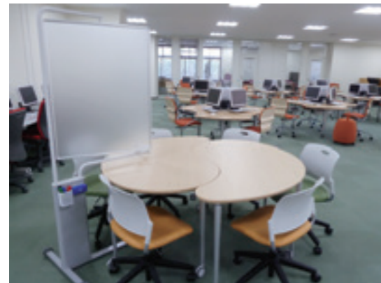
ラーニング・commons Learning Commons