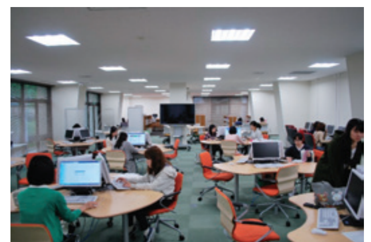
ラーニング・commons（学術情報センター1階）

学術情報センターは、耐震改修工事を平成27年9月から平成28年2月まで実施し、無事完了しました。リニューアルされた学術情報センターは、1階は活発な議論ができるアクティブラーニングスペース、2階は静かな環境で学習できる空間を設けています。また、事務室を1階のカウンター内に集約し、ワンストップサービスを実現しました。