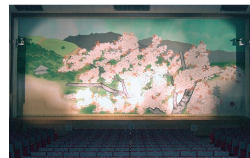
講堂緞帳「爛漫」(原画 小倉遊電画白) A thick Curtain "RANMAN" by Yuki Ogura in the Auditorium