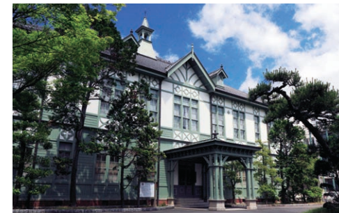
記念館(重要文化財) Memorial Hall (Important Cultural Property)