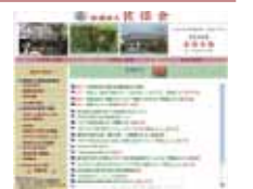
トップページのイメージ

同窓会である社団法人佐保会のホームページがリニューアルされました。やさしく明るい色調で、訪問者に分かりやすくなっています。是非ご利用ください。(http://www.nara-wu.ac.jp/dousoukai/sahokai/)