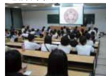
南京大学での大学説明会

★9月17日(水) 訪問先の南京大学で、留学希望の学生向けに説明会を行いました。日本学科以外の学生も含め60名ほどの学生が熱心に小山センター長と同行の国際課職員から話を聞き、盛んに留学に関する質問をしていました。