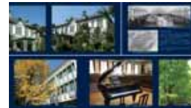
写真集の表紙とページ(一部)