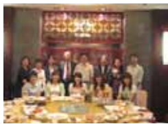
修了生のフェアウェルパーティー

8月22日(金)から9月19日(金)にかけて、南京大学での語学研修を実施しました。続いて、ニュージーランド・リンカーン大学での学生の英語力増進のため、語学研修の実施計画があります。2009年2月から3月にかけて4週間程度の研修を予定しています。このような、短期の語学研修を継続的に実施することで、学習成果を期待しています。