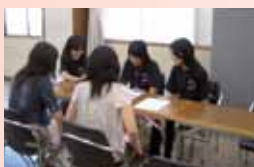
在学生相談コーナー

7月26日(土)に今年度第1回目のオープンキャンパスが開催されました。36.3度という猛暑にもかかわらず、929組1,690名という過去最多の参加者に来学いただきました。