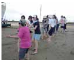
イチ、二、イチ、二…と掛け声高く

もっと、「日本人の学生と交流したい」「留学生と話したい」こんな声に応えて、8月2日(土)初めての交流事業を実施しました。泉州岡田浦で地引網を体験し、力いっぱい網を引いた後は、海鮮バーベキューでおなかいっぱい、おしゃべりいっぱいの、楽しいひとときを過ごしました。