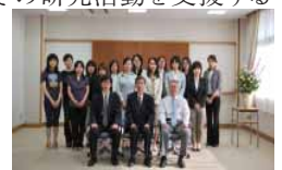
(前列左から)清水副学長、久米学長、野口研究科長と採択者

7月1日(火)事務局管理棟第2会議室において、今年度の若手女性研究者支援経費採択者に対する採択通知式が開催されました。この支援経費は、35歳未満の大学院博士後期課程2回生以上の優秀な学生等に対し、その研究活動を支援するために、平成 17 年度から実施されています。今年度は 22 名の応募があり 18 名が採択されました。採択者は「奈良女子大学大学院奨励研究員」の名称を付与され、総額 400 万円の研究支援経費が配分されます。