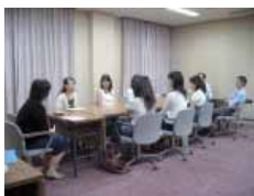
留学生生活を熱く語る

学生交流協定に基づき留学していた学生が帰国したのを機に、学長を囲んで懇談会形式の報告会を実施しました。留学先での様々な体験談を熱心に語ってくれる学生に、学長からもいろいろな質問が寄せられ、にぎやかな懇談会となりました。懇談会には、今年派遣される学生も同席し、留学生活のアドバイスを求めたこともあり、予定時間を超過しましたが、有意義な報告会になりました。