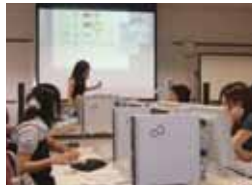
「企画書作成スキル習得」授業風景

教育の柱として「キャリア教育科目」を掲げている本学では、就職や進学などの将来設計に早期から取り組むための科目群として、スキルの習得や実地体験を通じ、実践力をつけることを目的とする「キャリアデザインゼミナール」を開講しています。ここでは、7月から8月にかけて実施された授業の一部をご紹介します。「企画書作成スキル習得」