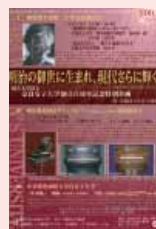
特別企画ポスター

これらのイベントについては、詳細が決まり次第、創立 100 周年記念事業ページ( http://www.nara-wu.ac.jp/100th/ )でお知らせいたします。どうぞご期待ください。