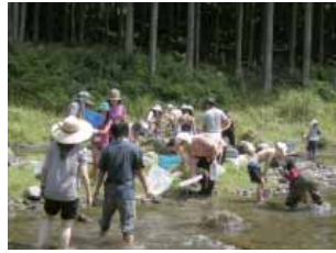
川の生物に親しむ参加者

共生科学研究センターでは、8月3日(日)～4日(月)の一泊二日で、東吉野村の共生科学研究センター分室(旧四郷小学校)を拠点として、小中高校生対象の野外体験実習を開催しました。