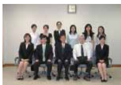
留学生奨学金授与式

なお、この事業の実施から今年度までの奨学金授与者は、延べ103名にのぼっています。