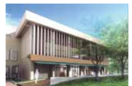
完成予想イメージ(外観)

文学部南棟 1 階で大学ラウンジ(仮称)の建設工事が始まりました。ラウンジ利用以外に、セミナーやセミナー開催なども可能な開放的でアカデミックなスペースとなるように計画されており、今年中に完成予定です。