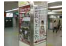
左側がリニューアルした面

大学の認知度を向上させるUI(University Identity)プランの一環として、平成17年から近鉄奈良駅の地下コンコース東券売機前にイメージ広告を2枚設置しており、8月に1枚をリニューアルしました。