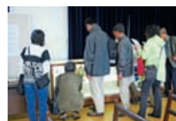
「雲珠」を見学する来館者