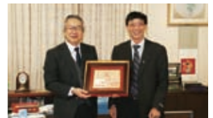
ベトナム国家大学ハノイ外国語大学学長と