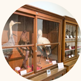
理学部 剥製標本 骨格標本