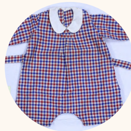
生活環境学部 奈良女子大学の 裁縫教材研究