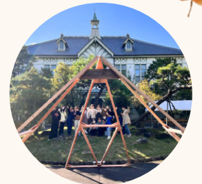
工学部 PBL(創造的課題解 決型演習)の成果